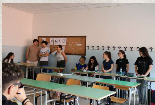
interview à la quatrième